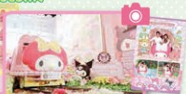
6 ~My Melody & KUROMI~ Mymeroad Drive