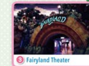
3 Fairyland Theater