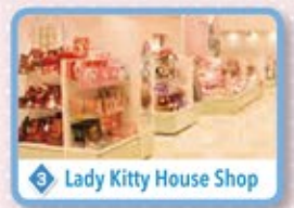
Lady Kitty House Shop