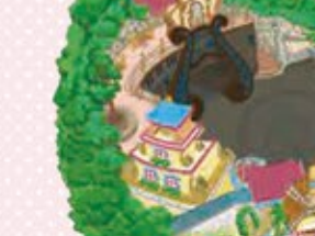
4 Sanrio Character Boat Ride