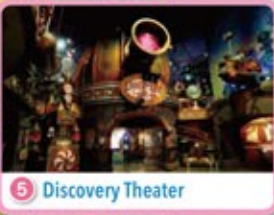
5 Discovery Theater