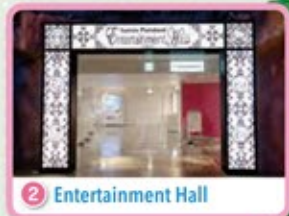
2 Entertainment Hall