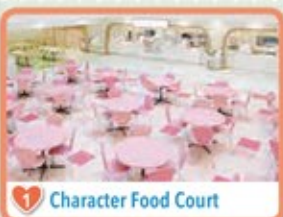
1 Character Food Court