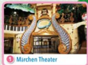
1 Marchen Theater