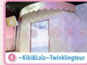
6 ~Kiki&Lala~ Twinklingtour