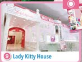
9 Lady Kitty House